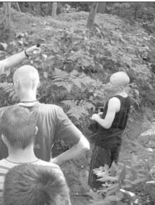
Mart Laar koos noortega matkarajal